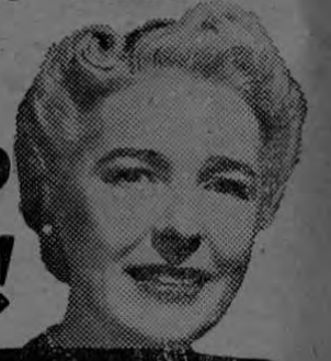
Tía Julia dice que ella nunca permite que el estreñimiento la agobie.

Si sufren de ESTREÑIMIENTO entérense de este mensaje!